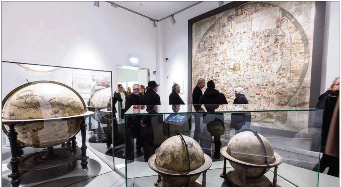
Wie sich das Bild von der Welt wandelt, zeigen die berühmte Kopie der Ebstorfer Weltkarte und historische Globen.